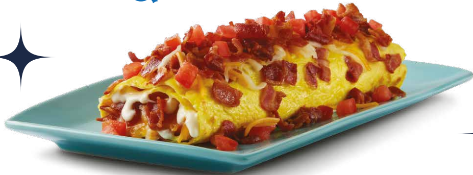
BACON TEMPTATION OMELETTE