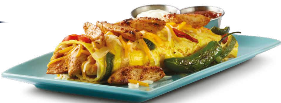
CHICKEN FAJITA OMELETTE

Ahora también come TODOS los Buttermilk Pancakes que puedas con la compra de tu Omelette favorito.