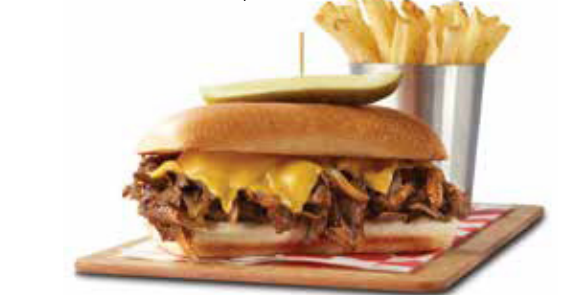
PHILLY CHEESE STEAK STACKER

Bistec Philly asado (170 gr) con cebollas, cubierto con queso americano derretido en un pan tostado.