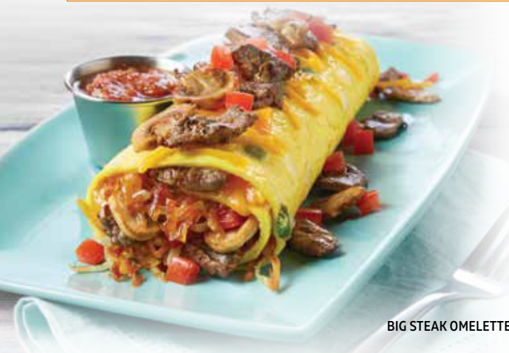
BIG STEAK OMELETTE