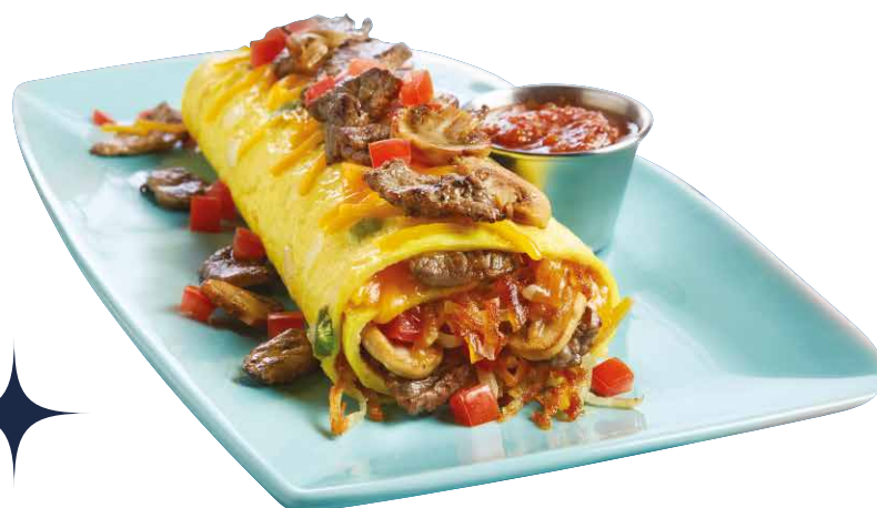
BIG STEAK OMELETTE