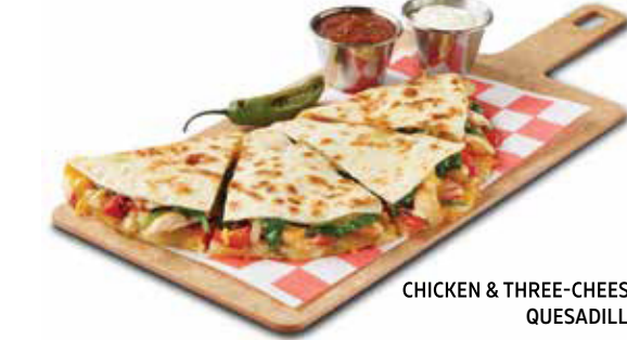
CHICKEN & THREE-CHEESE QUESADILLA

Tiras de pechuga de pollo asadas (170 gr) con pimienta roja, quesos Pepper Jack, Monterrey Jack y Cheddar con espinacas en una tortilla de harina caliente. Se sirve con nuestra salsa roja, crema agria y chile serrano a la parrilla.