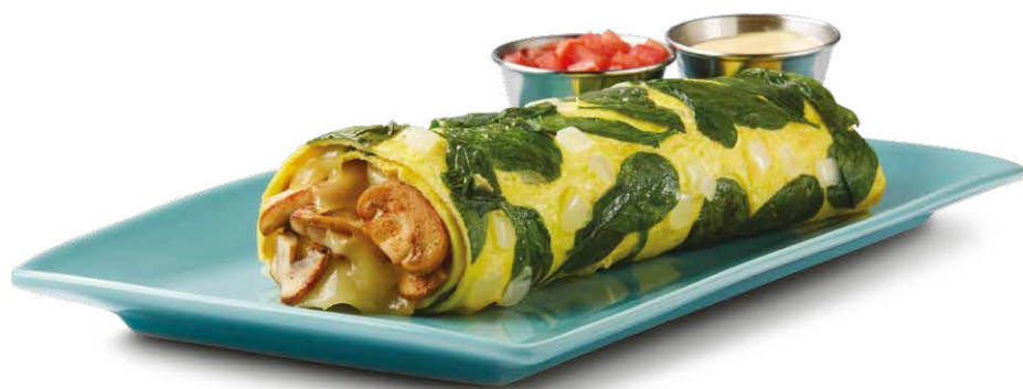
SPINACH & MUSHROOM OMELETTE