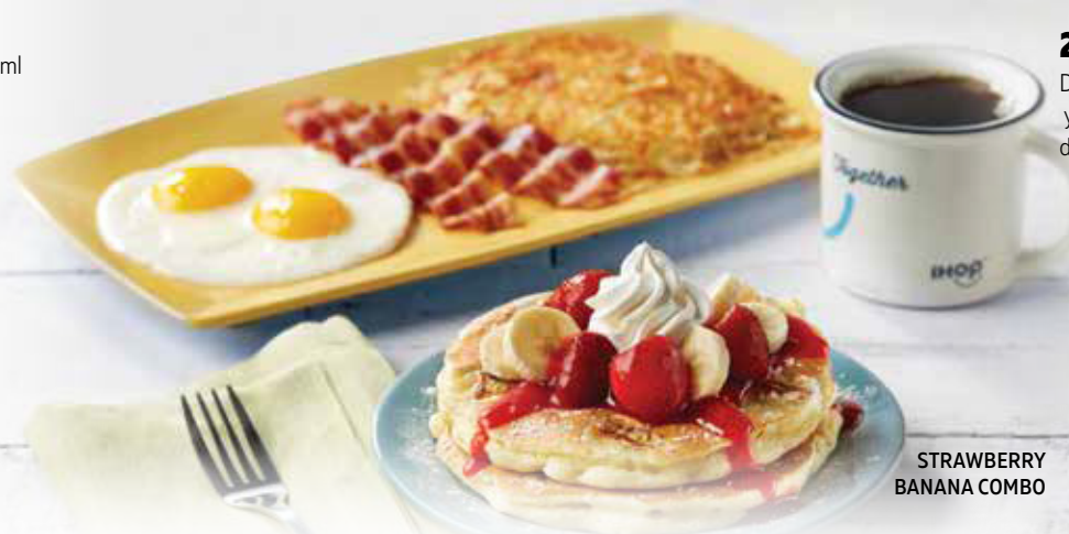
STRAWBERRY BANANA COMBO

Dos huevos, dos tiras de tocino o dos salchichas y dos Buttermilk Pancakes. *NO APLICA elección de: Buttermilk Pancakes o pan tostado o fruta fresca.