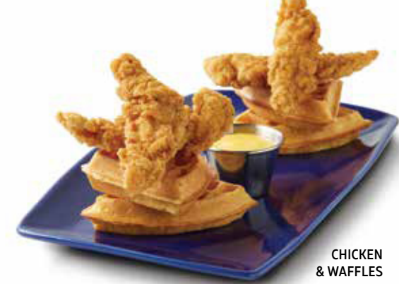
CHICKEN & WAFFLES

Cuatro crujientes tiras de pollo empanizadas (170 gr), con cuatro triángulos de waffles con mantequilla batida y aderezo honey mustard.